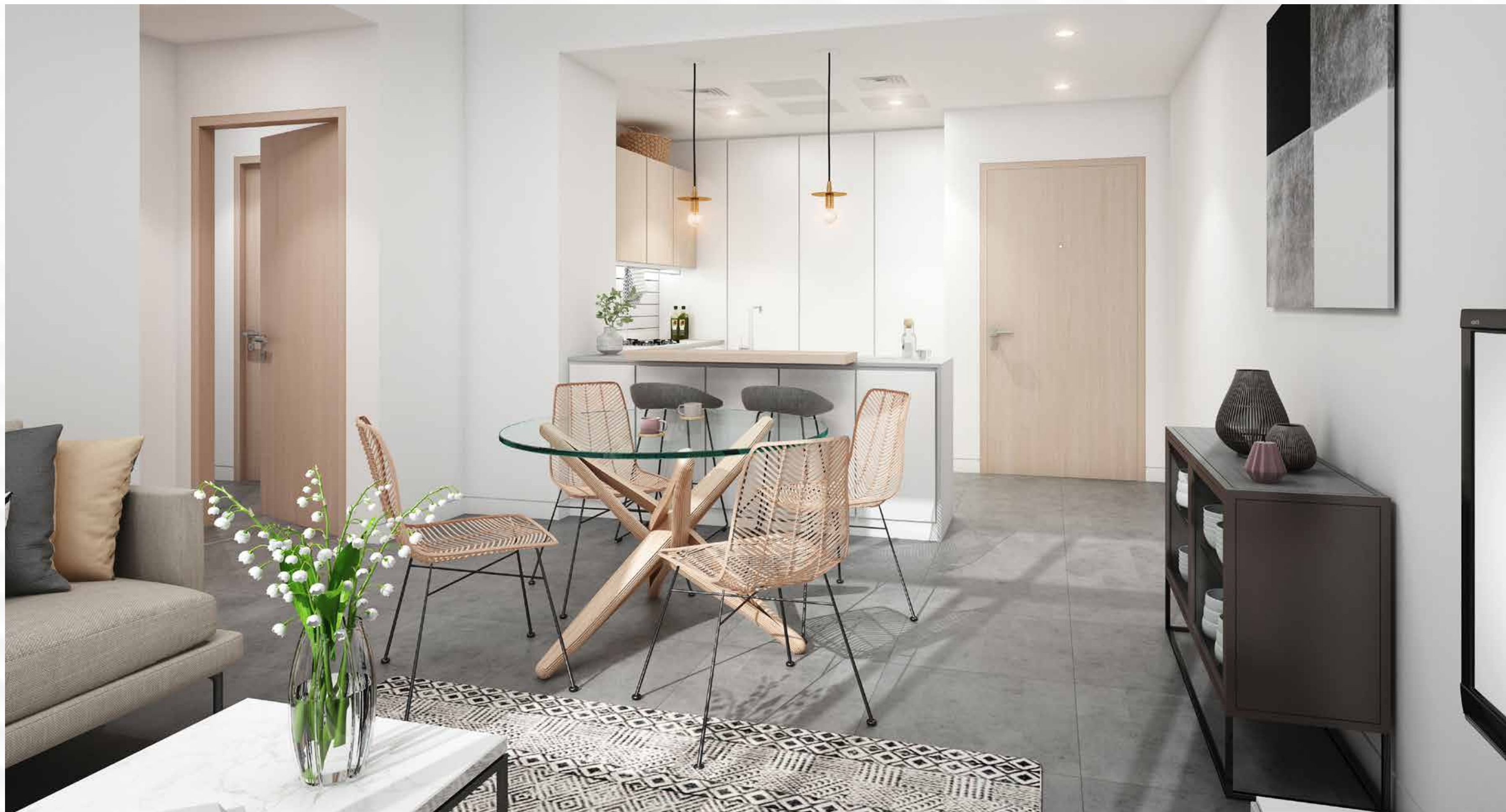
LIVING ROOM غرفة معيشة